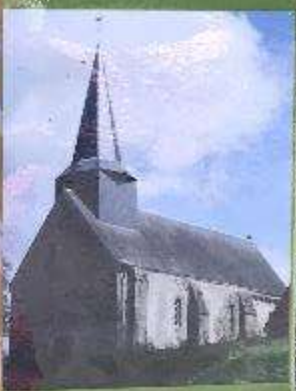
Eglise de Chantôme FODDGLASS 2011

La fontaine est située à 30 mètres de l'église en contrebas. Au rez-de-chaussée, à côté de moules en terre, un simple cadre de pierres (37cm x 42 cm) marque la source, avec au-dessus une borne de pierre (1,6m x 95 cm et 25 cm de hauteur). Le pèlerinage est à lieu le dimanche précédent l'Ascension voir voir les enfants aller en « convalescence », par les adolescents et les enfants adultes en « culte de St Sylvain ». Une médaille est distribuée après la messe. Ensuite, une procession fait oration à travers le village, les fidèles récupèrent les vêtements du malade dans la fontaine, succédant à de l'eau, déposant au gorge à l'église et un peu d'argent. Il en résulte de nombreux miracles de guérison à travers le siècle.