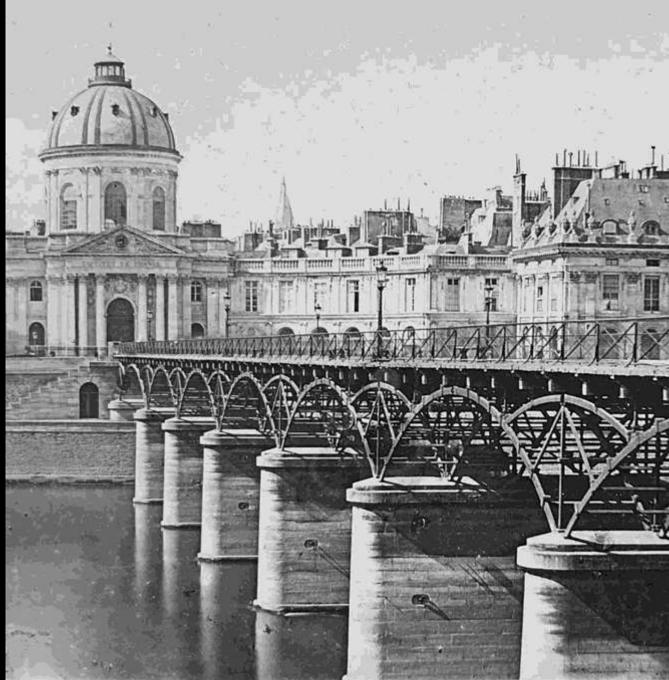
17. Sont des Arts - Institut.