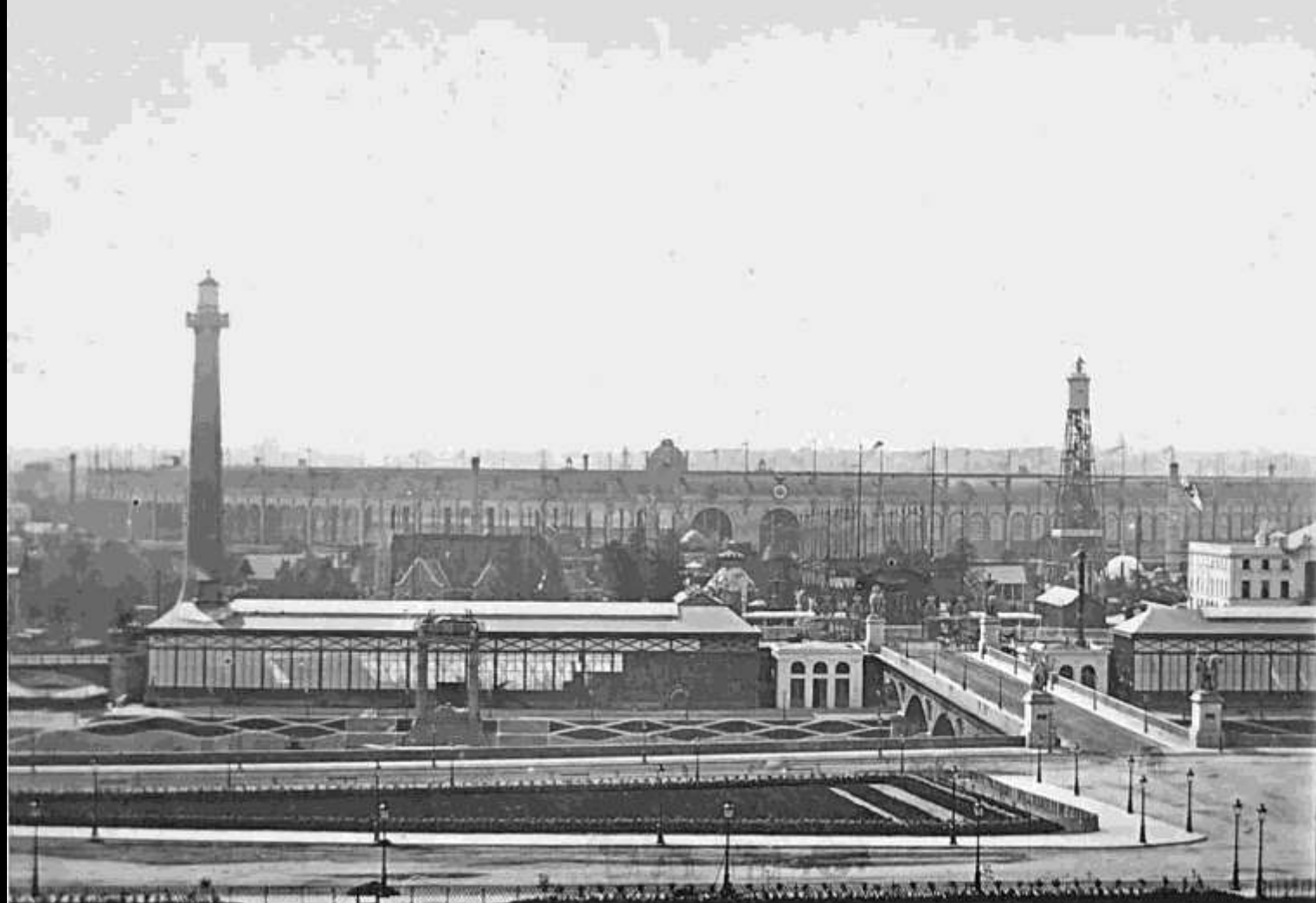
206. Vue générale de l'Exposition