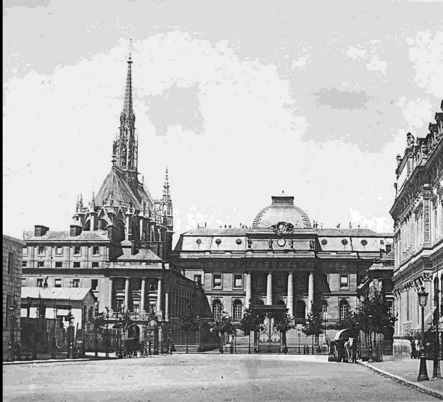
43. Palais de Justice - Sainte Chapelle