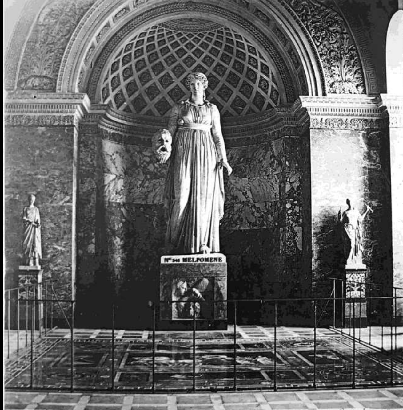
337. Statue de Melpomène. galerie des Antiques (Louvre)