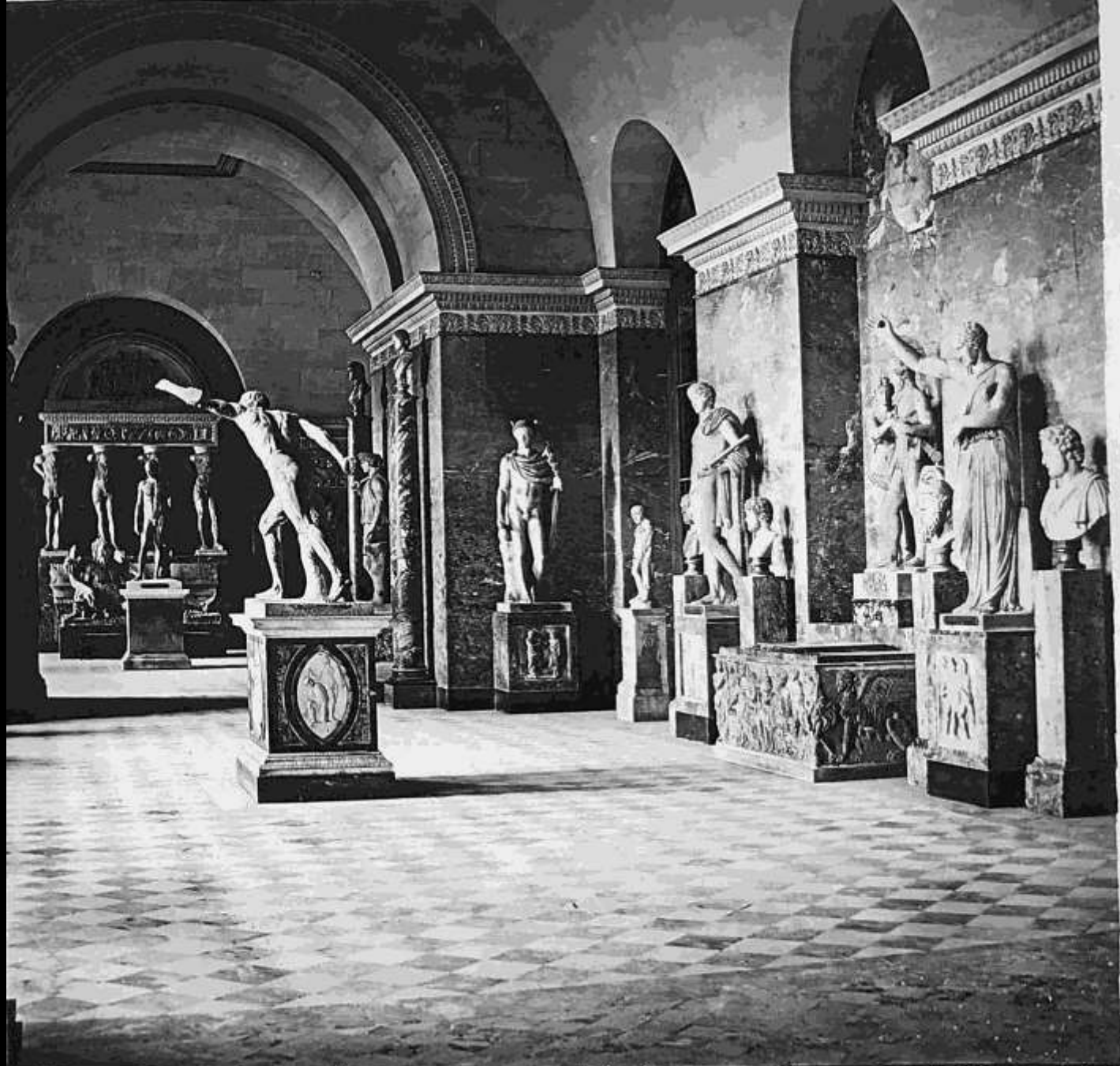
327. Le gladiateur galerie des antiques (Louvre)