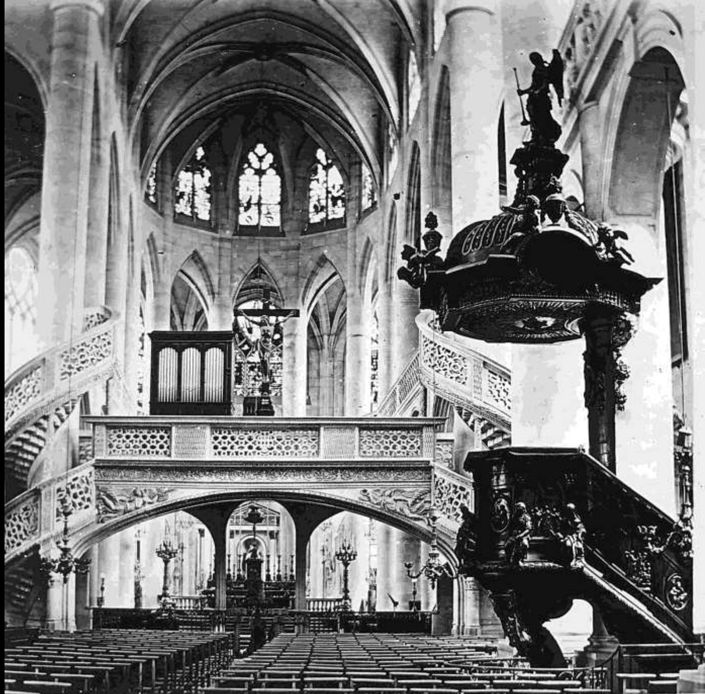
600- Vue de l'église de St Pierre du Mont