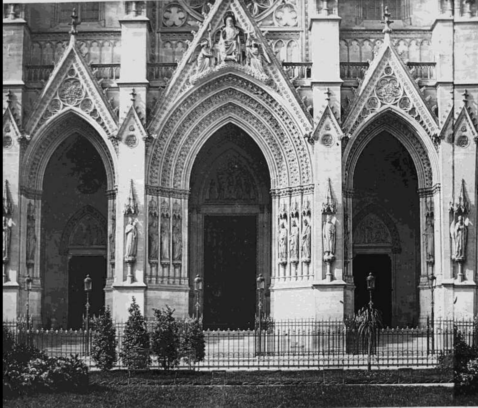
117. Portail de l'église St Maximilien