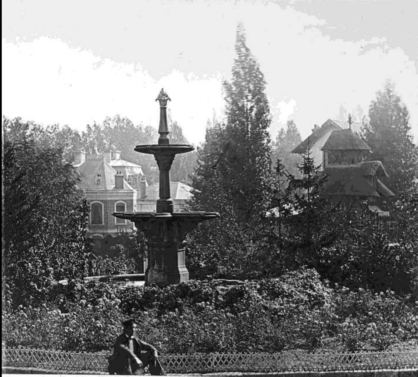
Vue prise à la Villa Montmorency. Québec