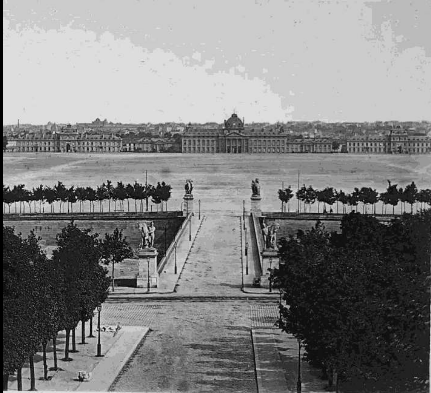
58 - Champ de Mars. Ecole Militaire