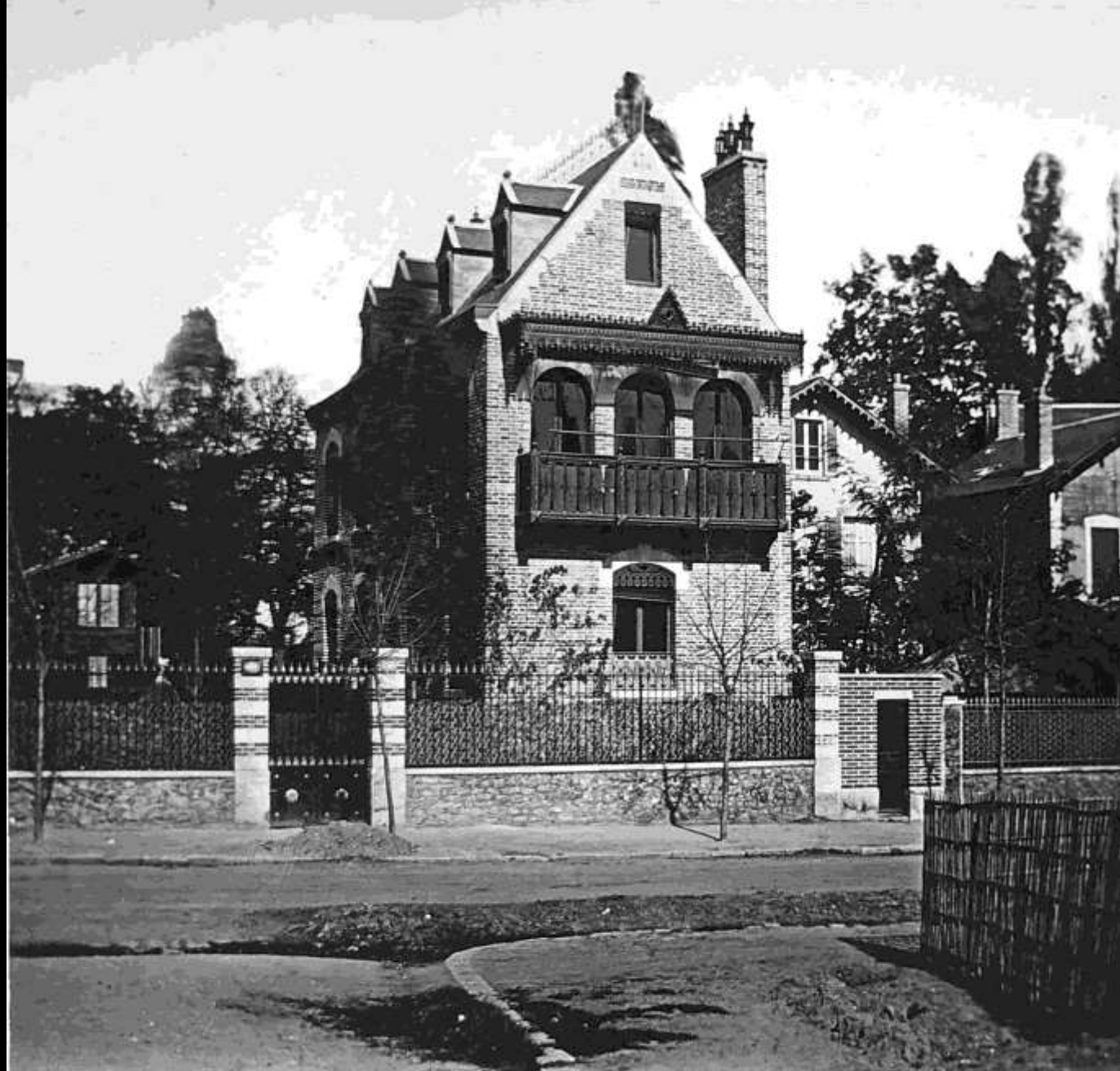
Villa à Cautueil